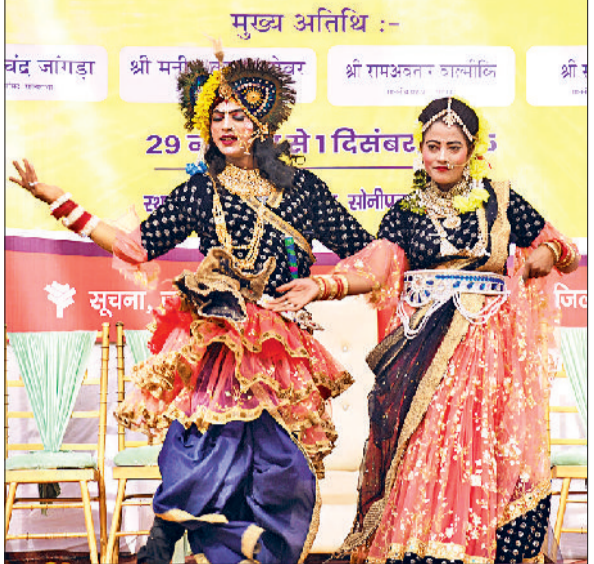
गीता जयंती महोत्सव में कार्यक्रम में प्रस्तुति देते कलाकार।