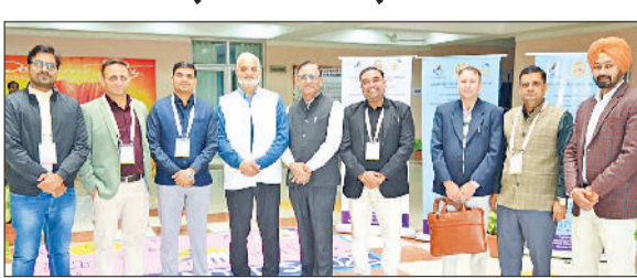
रोहतक। एमडीयू में आयोजित सम्मेलन में मौजूद गणनायक विशेषज्ञ।