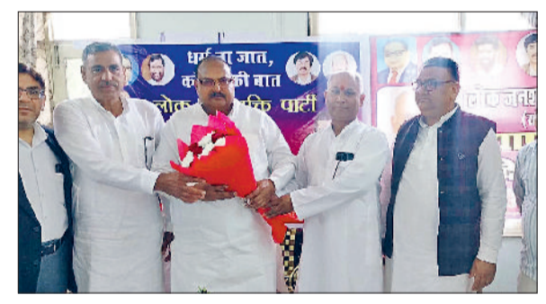
रोहतक। लोक जनशक्ति पार्टी (रा) का स्थापना दिवस पर मौजूद पदाधिकारी।