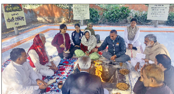
रोहतक। हवन में आहुति डालते आर्य समाजी।