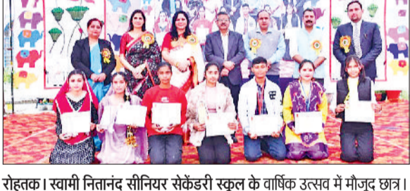
रोहतक। स्वामी नितानंद सीनियर सेकेंडरी स्कूल के वार्षिक उत्सव में मौजूद छत्र।

विद्यालय में भारतीय त्योहार थीम पर मनाया वार्षिक उत्सव